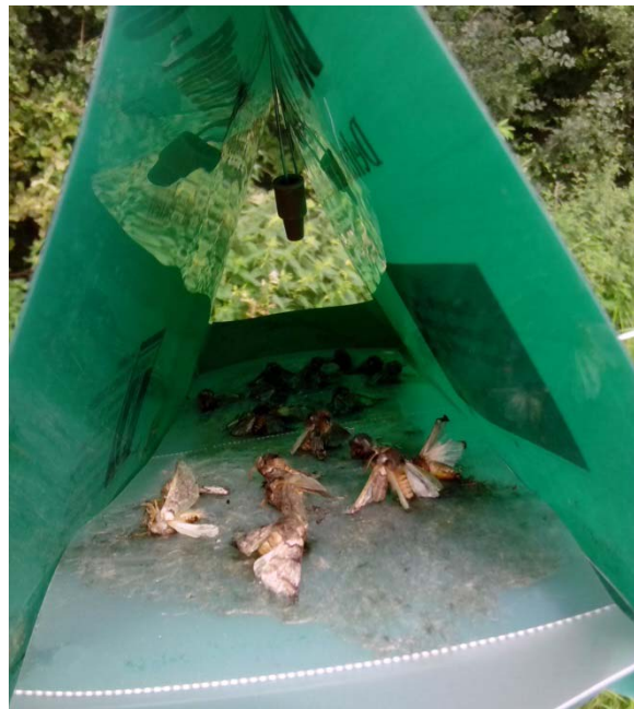
Abb. 1: Männlicher Falter des Eichenprozessionsspinners in einer Delta-Pheromonfalle

Der Falterflug des Eichenprozessionsspinners hat in der 27. Kalenderwoche eingesetzt und endete in der Kalenderwoche 34 (s. Abb. 2).