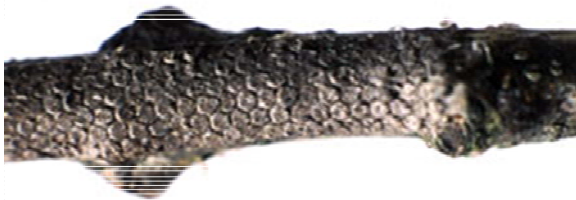
Abb. 3: Eigelege des Eichenprozessionsspinners

In der Zeit des Falterflugs wurden am Referenz-Standort „Möhlin“ 798 männliche Falter mittels Pheromonfallen gefangen. Dies stellt im Vergleich zu den beiden Vorjahren eine Erhöhung der Fallenfänge dar (2017: n = 489 ; 2016: n = 382 ). Die Kulmination des Falterfluges erfolgte im Jahr 2017 in der Kalenderwoche 30 und somit analog zu den Vorjahren (2017: KW 30; 2016: KW 31).