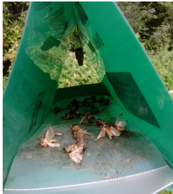
Abb. 1: männlicher Falter des Eichenprozessionsspinners in einer Delta-Pheromonfalle

Der Falterflug des Eichenprozessionsspinners hat in der 28. Kalenderwoche eingesetzt und endete in der Kalenderwoche 34 (s. Abb. 2).