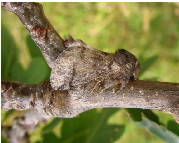
Abb. 3: Imago des Eichenprozessionsspinners

In der Zeit des Falterflugs wurden am Referenz-Standort „Möhlin“ 489 Falter mittels Pheromonfallen gefangen. Dies stellt im Vergleich zu den beiden Vorjahren eine Erhöhung der Fallenfänge dar (2016: n = 382 ; 2015: n = 261 ). Die Kulmination des Falterfluges erfolgte im Jahr 2017 in der Kalenderwoche 30 und somit früher als in den Vorjahren (2016: KW 31; 2015: KW 32).