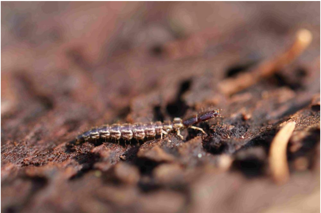
Abb. 6: Kamelhalsfliegenlarve, ein typischer Borkenkäfer-Räuber

Quidquid agis, prudenter agas et respice