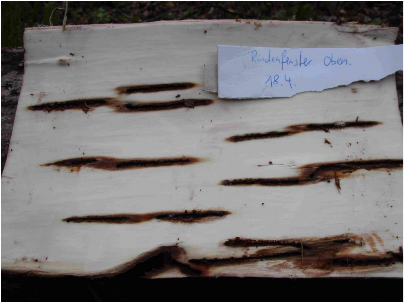
Abb. 5: die Muttergänge wurden weiter ausgebaut, doch dann kam die Kälte. Ob die Brut dies überleben wird...?

Derzeit gibt es keinen Neubefall, Claimkontrollgänge sind überflüssig.