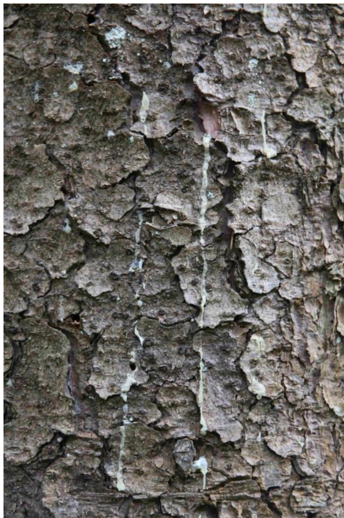
Abb. 3: Horch, was kommt von draußen rein? Das kann ja nur ein Käfer sein! Einbohrloch und Harzabwehr – das zu erkennen, fällt gar nicht schwer

Heute weitet Hoch Querida seinen Einfluss langsam nach Süden hin aus. Schauer beschränken sich so auf den Südosten, bereits oberhalb 400 m fällt Schnee, an den Alpen weiter anhaltend. Im Rest des Landes setzt sich dagegen immer mehr die Sonne durch. Die Temperaturen bleiben mit 3 bis 10 °C weiter verhalten. Die Nacht zum Donnerstag wird vielerorts die kälteste Nacht der Woche und des Aprils. Bis auf einige Inseln und manche Küstenabschnitte herrscht Frost zwischen –1 und –6 Grad, vereinzelt wird es noch etwas kälter.